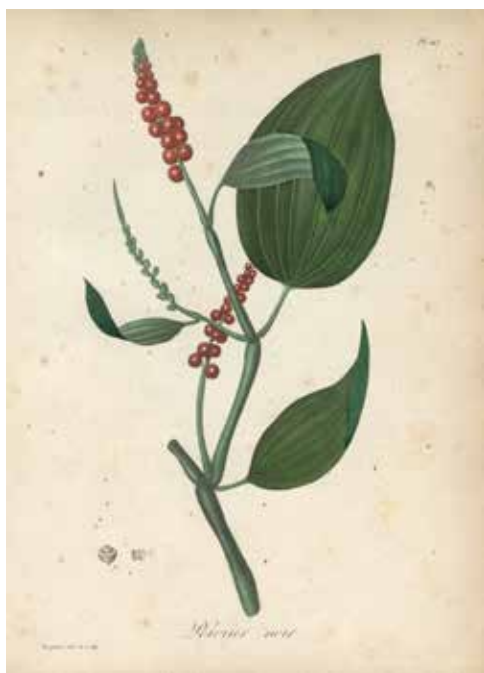
Poivrier noir. . Planche extraite de Pythographies médicales - ROQUES.

Dès l'Antiquité, ces épices sont connues des Grecs et des Romains, grâce aux routes terrestres et maritimes reliant l'Inde à l'Occident. Au 15 e siècle, ces routes sont fermées par la conquête ottomane : les Européens se tournent alors vers l'océan. Les Portugais sont les premiers à atteindre l'Inde en contournant l'Afrique. C'est dans cette dynamique que sont créées, 150 ans plus tard, les compagnies des Indes orientales motivées par le monopole du commerce des épices et des pierres précieuses.