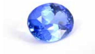
Ensemble de saphirs bruts et saphir taillé. Origine Sri Lanka. Coll. Particulière