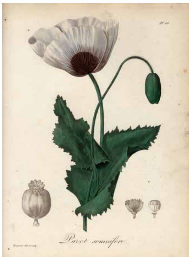
Pavot somnifère. Planche extraite de Pythagories médicales - ROQUES.