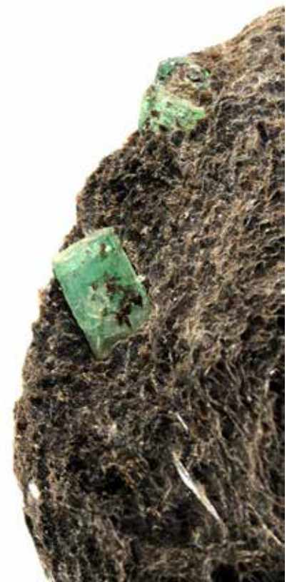
Émeraude sur schiste micacé, Égypte. Coll. Muséum de Nantes