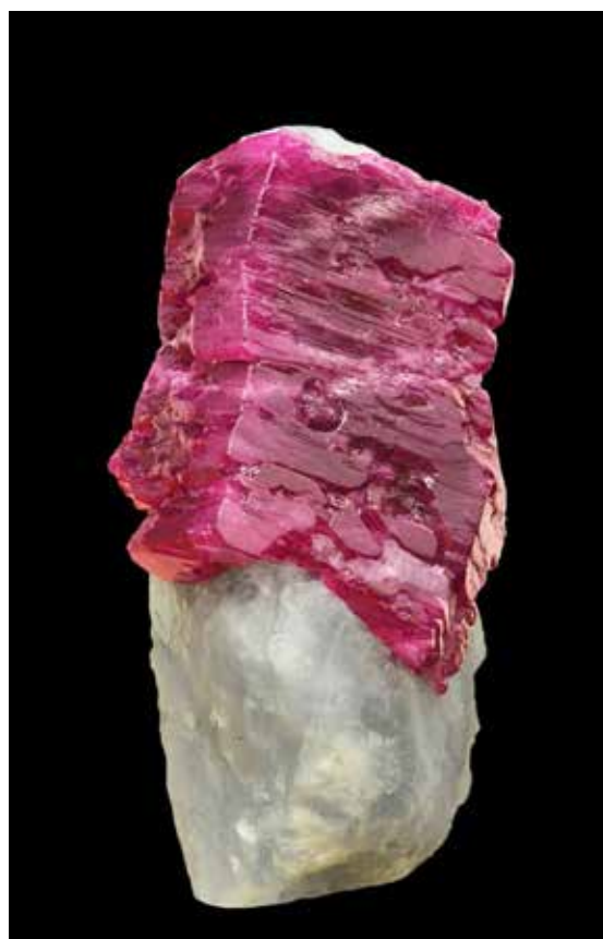
Rubis de 1 700 carats « King of Mogok ». Coll. Particulière

Les bijoux birmans sont alors transportés d'est en ouest vers les cours des maharajas, des sultans, des empereurs et des rois. Aujourd'hui encore, ils alimentent les plus luxueuses bijouteries du monde.