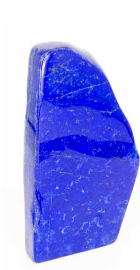
Lapis-lazuli, Afghanistan. Coll. Particulière

Sur le territoire de la Perse antique, l'ancienne cité Bactres, en Afghanistan, et la ville de Téhéran, en Iran, se situent sur le chemin des caravaniers de la route de la soie. Montagnes impénétrables, plateaux désertiques, climats extrêmes, l'Afghanistan est une véritable forteresse naturelle dont les richesses minérales sont exploitées depuis l'Antiquité. Encore aujourd'hui, ce pays reste le principal fournisseur d'une pierre ornementale très prisée : le lapis-lazuli, dont le gisement le plus connu est la mine de Sar-e-Sang, à 3 000 m d'altitude. C'est également sur ce territoire que le précieux pavot à opium est repéré dès le 13 e siècle par Marco Polo, dans le corridor du Wakhan, situé dans les hauteurs des montagnes de l'Hindu Kush, entre le Tadjikistan, le Pakistan et la Chine. Plus à l'ouest, au nord de l'Iran, dans la région du Khorassan, sont extraites les plus belles turquoises du monde.