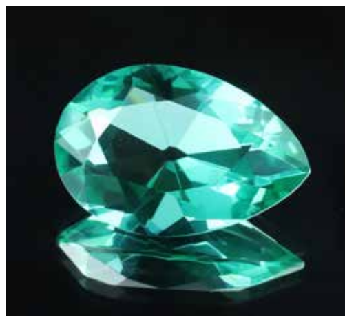
Répliques de diamants célèbres. Coll. Musée de minéralogie, MINES, Paris-Tech