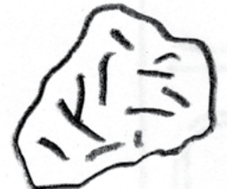
un grain de sable